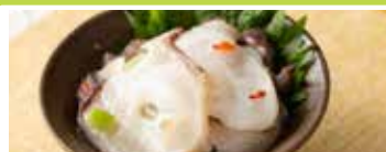
札幌〈味遊たくみや〉 お刺身たこわさび 100g ..... 1,188円