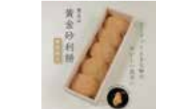
愛知〈覚王山フルーツ大福 弁才天〉 黄金砂利餅 5粒……………1,281円