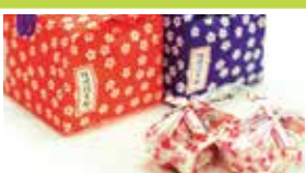
山梨〈桔梗屋〉 桔梗信玄餅 6個入……………1,426円