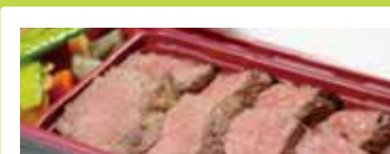
札幌〈くろべこや〉 北海道産ステーキ弁当 ..... 1,397円