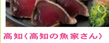
和歌山〈丸福本舗〉 四天の梅(無選別) 塩分5% ハチミツ漬 380g 1,890円