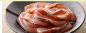
札幌〈味遊たくみや〉 厚切りいか塩辛 150g ..... 1,188円