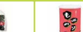
東京〈白子のり〉 手巻きのり 5袋詰(2切5枚) ..... 1,555円