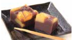
岩手〈御菓子司 つちや本舗〉 栗蒸しようかん 4個入……………881円