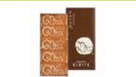
神奈川〈鎌倉紅谷〉 クルミッ子 5個入 ………………891円