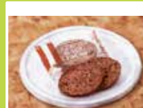
群馬〈ガトーフェスタ ハラダ〉 グーテ・デ・ロワ カカオ 簡易小袋 2枚入×8袋(16枚) ………………1,080円