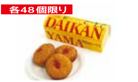
各48個限り 東京〈代官山シェ・リュイ〉 冷凍・代官山カレーパン 辛口・レギュラー 各5個入 1,361円