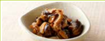
札幌〈味遊たくみや〉 つぶ甘露煮 100g ..... 1,188円