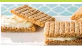
東京〈シュガーバターサンドの木〉 シュガバターサンドの木 10個入……………900円