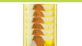
東京〈東京ひよ子〉 東京ひよ子サブレー 7個入……………1,037円