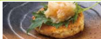
宮城〈大地フーズ〉 いわしハンバーグ 8枚入 ..... 1,296円