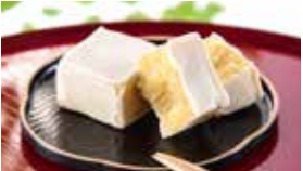
岩手〈御菓子司 つちや本舗〉 芋きんつば 4個入……………881円