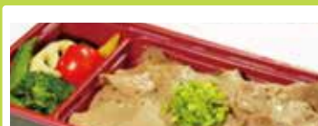
札幌〈くろべこや〉 ネギ塩牛タン弁当 ..... 1,697円