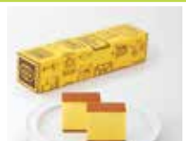
長崎〈福砂屋〉 カステラ小切れ0.6号 360g/10切れ 1,458円