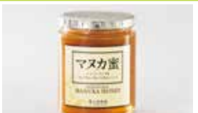
熊本〈杉養蜂園〉 マヌカ蜜 500g……………8,424円