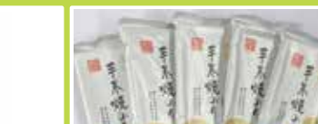
東京〈白子のり〉 手巻きのり 5袋詰(2切5枚) ..... 1,555円