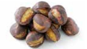
京都〈栗寿園〉 焼き栗 240g……………1,188円