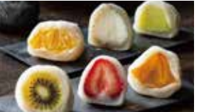
愛知〈覚王山フルーツ大福 弁才天〉 フルーツ大福 1個……………651円から