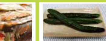
東京〈白子のり〉 焼のり金3帖合せ 板のり10枚 3袋詰め ..... 2,247円