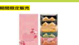
期間限定販売 〈ねんりん家〉 春限定ひとくちマウントバーム 4種5個入……………1,512円