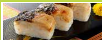
留萌〈丸夕田中青果〉 やん衆にしん漬 200g ..... 648円