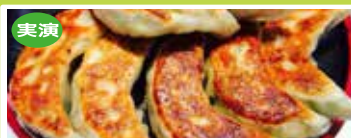
富山〈金田商店〉 宇都宮ジャンボ餃子 1パック10個入 ..... 1,291円