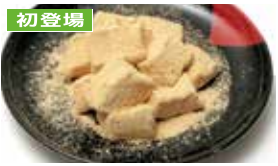
初登場 熊本〈匂香〉 黒糖わらび餅 200g……………810円