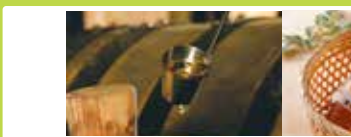
東京〈白子のり〉 白子のり もみのり 30g缶 30g ..... 698円