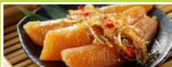
札幌〈味遊たくみや〉 別製数の子松前 100g ..... 1,188円

■ 4月25日(土)～4月29日(水・祝) 午前10時～午後6時 ※最終日午後4時終了 ■ イオンモール釧路昭和1階 特設会場