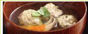
宮城〈大地フーズ〉 伊達のいわし団子 10玉入 ..... 1,296円