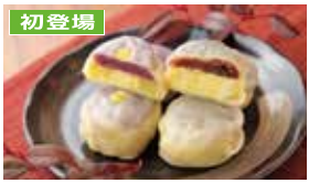
初登場 熊本〈匂香〉 いきなり団子(小豆あん・紫芋あん) 各1個……………270円

■ 4月25日(土)～4月29日(水・祝) 午前10時～午後6時 ※最終日午後4時終了 ■ イオンモール釧路昭和1階 特設会場