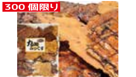
300個限り 岩手〈くら・いわて〉 丸助みくくす (割れ・無選別かりんとう) 180g……………648円