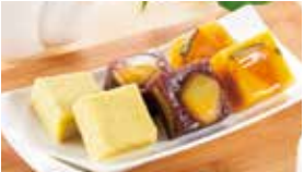
岩手〈御菓子司 つちや本舗〉 栗蒸しようかん詰合せ 8個入……………1,601円