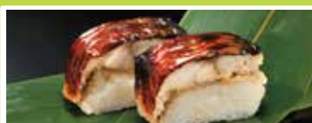
和歌山〈丸福本舗〉 アイス梅 6粒 ..... 1,500円