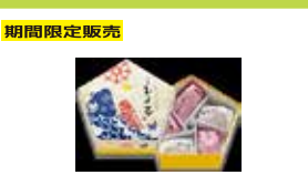
期間限定販売 東京〈東京ひよ子〉 端午の節句ひよこ 5個入……………913円