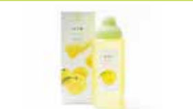
熊本〈杉養蜂園〉 ゆず蜜 各種 500g……………1,998円