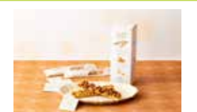
神奈川〈鎌倉紅谷〉 クルミとパイ〜クルミッ子キャラメル ソースを添えて〜4本入 962円