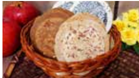
岩手〈志賀煎餅〉 南部煎餅3種詰合せ 13枚入……………1,296円