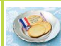
群馬〈ガトーフェスタ ハラダ〉 グーテ・デ・ロワ 簡易大袋 2枚入×13袋(26枚) ………………1,296円