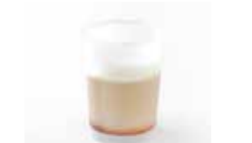
京都〈栗寿園〉 焼き栗プリン 1個……………486円