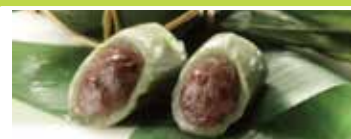
新潟〈越後商店〉 笹団子 5個入 ..... 1,151円