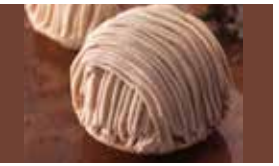
東京〈代官山シェ・リュイ〉 モンブランマロン 1個……………670円