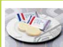
群馬〈ガトーフェスタ ハラダ〉 グーテ・デ・ロワ ホワイト チョコレート/簡易大袋 10枚……………1,296円