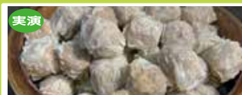
富山〈金田商店〉 特選焼売 1パック7個入 ..... 1,291円