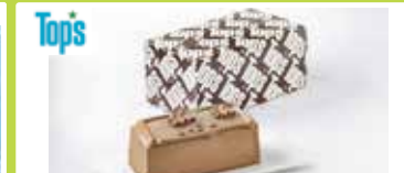
東京〈トップス〉 チョコレートケーキ Mサイズ(140×65×52mm) …… 2,106円