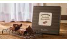
神奈川〈鎌倉紅谷〉 ポケットブラウニー 4個入 ………………1,707円