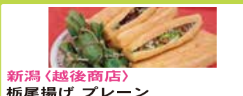
新潟〈越後商店〉 栃尾揚げ プレーン 491円 栃尾揚げ※画像はネギ納豆 681円