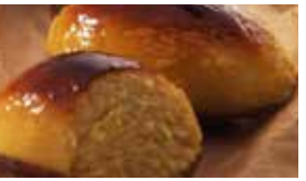
東京〈代官山シェ・リュイ〉 代官山スイートポテト 1個……………497円