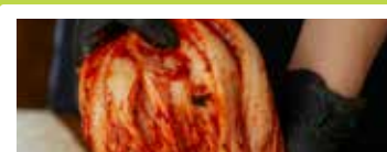
滋賀〈天平キムチ〉 白菜キムチ 100g ..... 281円