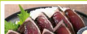
高知〈高知の魚家さん〉 藁焼きかつおたたき 100gあたり ..... 1,350円