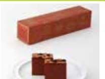
長崎〈福砂屋〉 オランダケーキ小切れ0.6号 350g/10切れ 1,458円