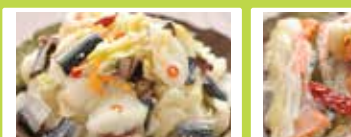
青森〈カネショウ〉 ①ハチミツ入りりんご酢 500ml ..... 1,404円 ②樽熟りんご酢 500ml ..... 951円