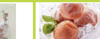
留萌〈丸夕田中青果〉 きゅうり焼酎漬 3本 ..... 712円