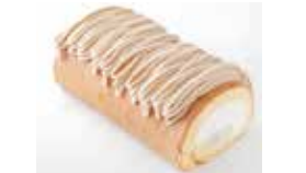
京都〈栗寿園〉 モンブランロール 1本……………2,160円