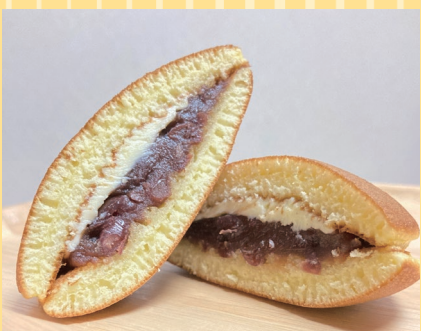
八雲町(八雲 くら屋菓子舗) バターどら焼 (90g、1個).....200円