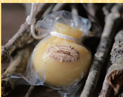
八雲町(八雲チーズ工房) カチョカバコ (155g).....1,010円