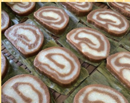
木古内町(秋山農園) べこもち (3枚入).....360円