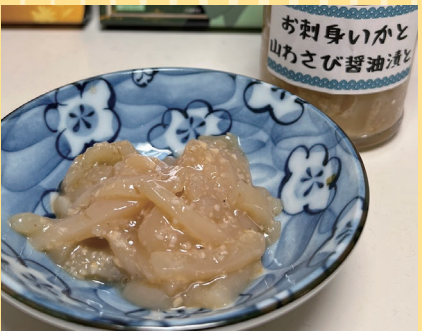
函館市(三栄水産工業) お刺身いかと 山わさび醤油漬と (130g、1ピン).....500円