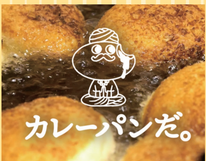
函館市(カレーパンだ。) カレーパンだ。 マジらまビーフカレーパン・ トロらまチーズカレーパン (1個).....各324円