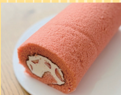
函館市(函館風月堂) 苺の生ロール (1本).....1,458円