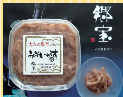
七飯町(たかせ商店) 大人の塩辛みそいかす (100g).....450円