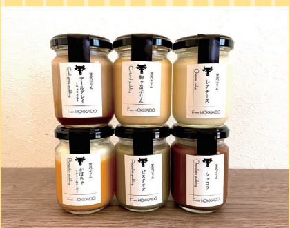
森町(商舎) 贅沢プリン 駒ヶ岳ぶりん(95g).....400円 レアチーズ(90g)、アールグレイキャラメル・かぼちゃ クリームチーズ・ショコラ(各100g) 各450円 ピスタチオ(100g).....500円