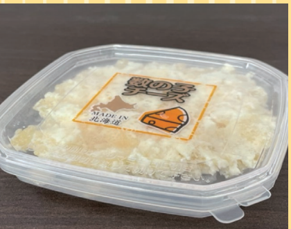
函館市(ま印水産) 数の子チーズ (80g).....650円