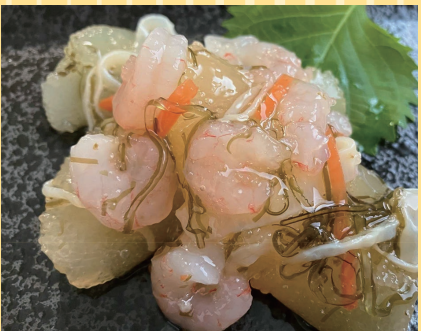
函館市(丸心 函館海鮮倶楽部) 甘えび数の子松前漬 (400g).....20点限定 1,500円