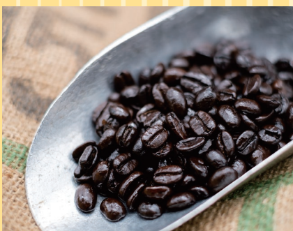
函館市(箱館元町珈琲店) 元町八幡坂ブレンド珈琲 (75g).....800円