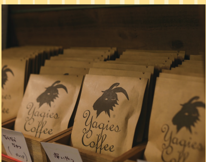
函館市(Yagies Coffee) コーヒードリップバッグ (1個).....140円