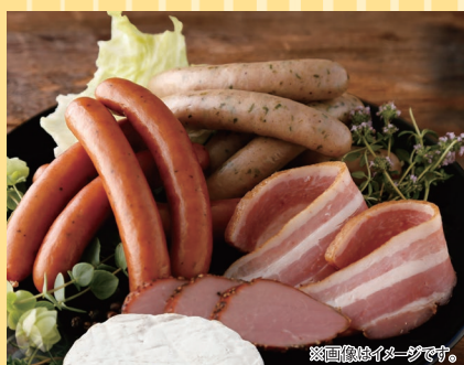
黒松内町(黒松内町特産物手づくり 加工センター トワ・ヴェール) スペアリブベーコン (100gあたり).....486円 荒挽きウィンナー (5本入).....486円