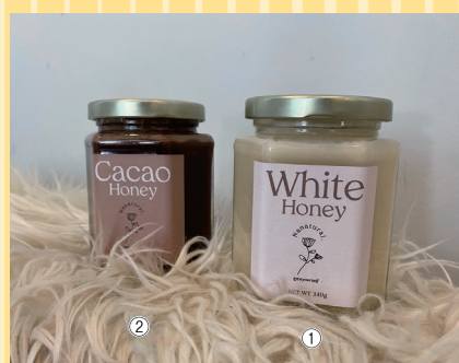
函館市 (オーガニックハチミツPONO) ①White Honey (カナダ産、340g).....5,900円 ②Cacao Honey (カナダ産、340g).....6,400円