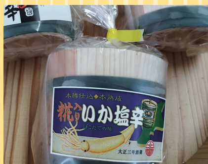
函館市 (函館 老舗106年 小田島水産食品) 糀入り いか塩辛 (130g).....1,080円