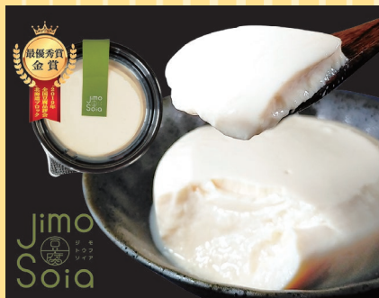
七飯町(Jimo豆腐Soia) Jimo豆腐「よせ」 (180g).....378円