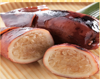
せたな町(マーレ旭丸) 漁師のいかめし(プレーン) (2尾).....951円