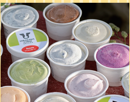
せたな町(ひらかわ牧場) カップアイスクリーム フレッシュミルク(100ml、1カップ)250円 チョコレート・せたなの潮トマト・ブルーベリーと ヨーグルト・黒胡麻・抹茶 ほか (100ml、1カップ).....各350円