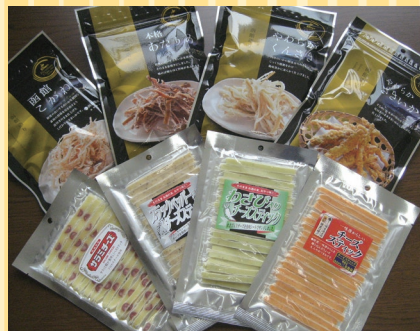
函館市(三友食品) 珍味 よりどり3点 .....1,000円