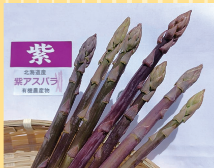
函館市(ソーシャル・エイジェンシー) 有機JAS 紫アスパラ (M~L、150g).....650円